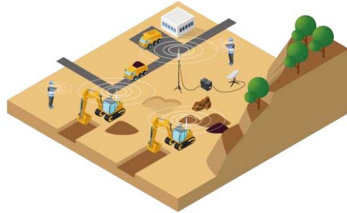
(“通信不感地対策Wi-Fiパック”を設置した現場)